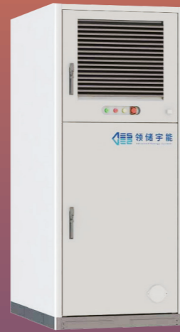
Ocean 200L 液冷储能系统