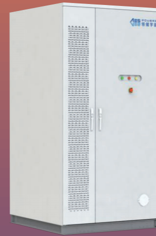
Ocean 400L 液冷储能系统