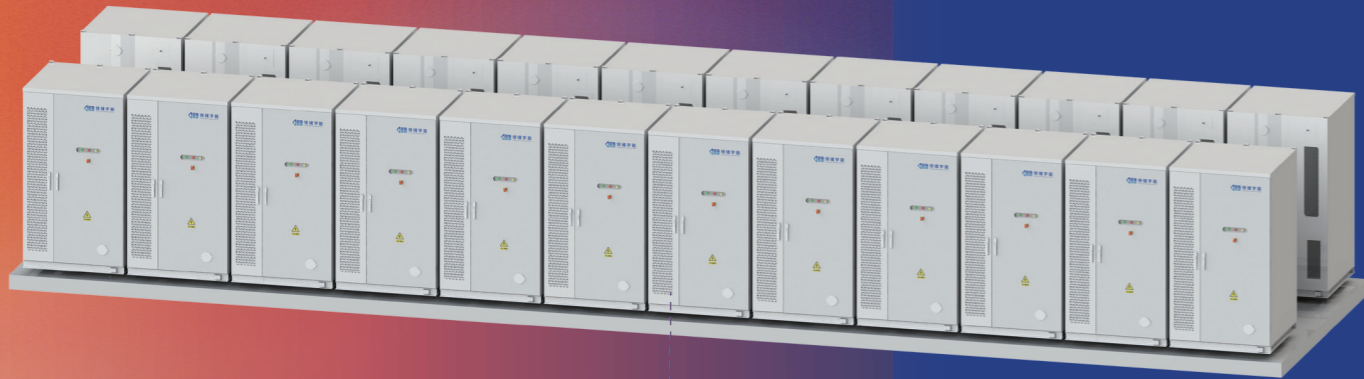
4.8MW/9.6MWh 组串式35kV中压储能系统子阵